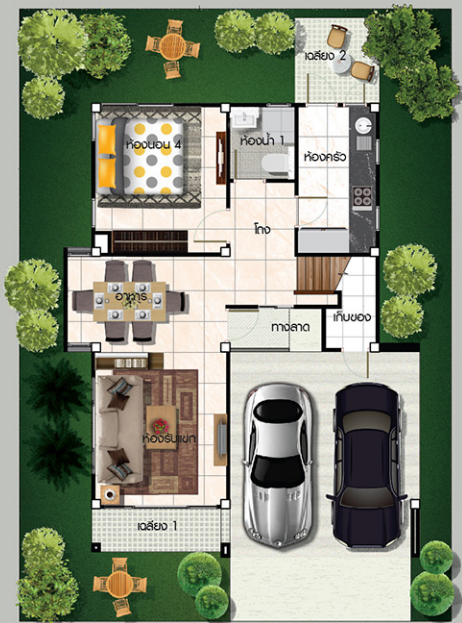
แบบพื้นที่ล่าง