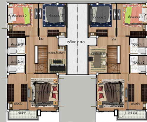
แบบผังชั้นบน

หมายเหตุ : พื้นที่ใช้สอยนับพื้นที่โดยประมาณ และขนาดพื้นที่อาจมีการเปลี่ยนแปลงโดยไม่แจ้งให้ทราบล่วงหน้า