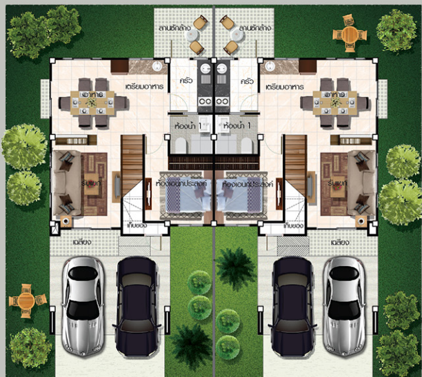
แบบผังชั้นล่าง