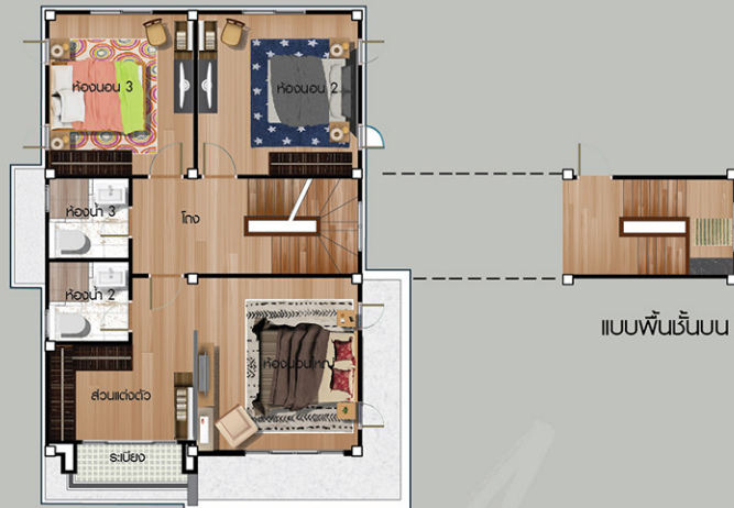
แบบพื้นที่บน

ราคา: 5.6 ล้านบาท (รวมภาษีที่ดินและสิ่งปลูกสร้าง)