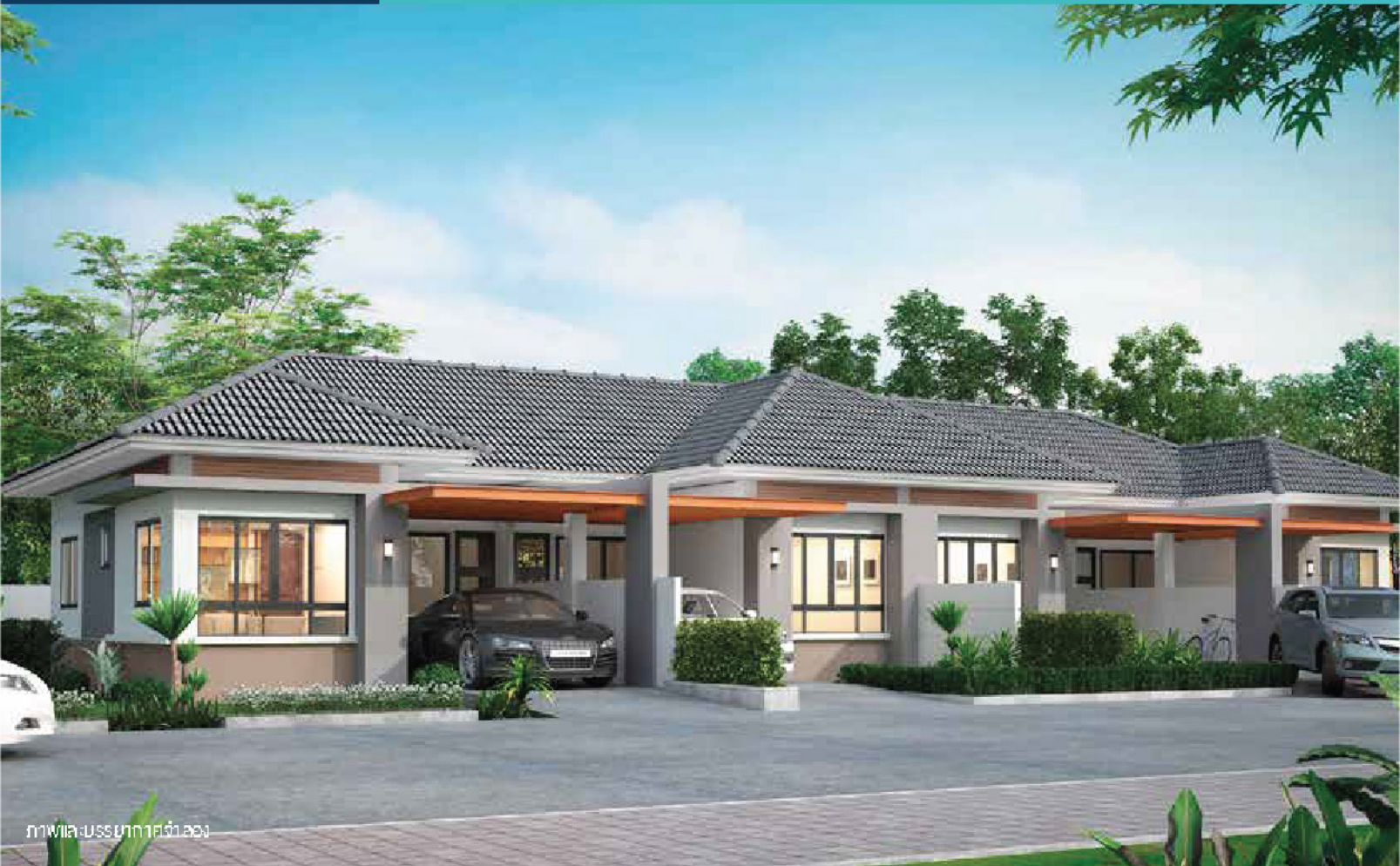
ภาพศิลปะบรรยากาศจำลอง