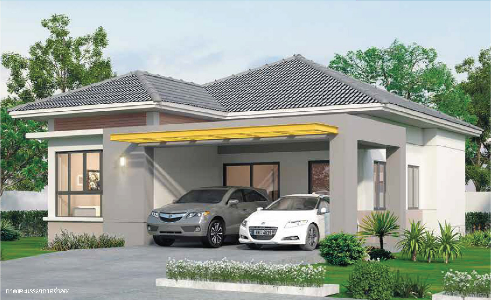
ภาพและบรรยากาศจำลอง