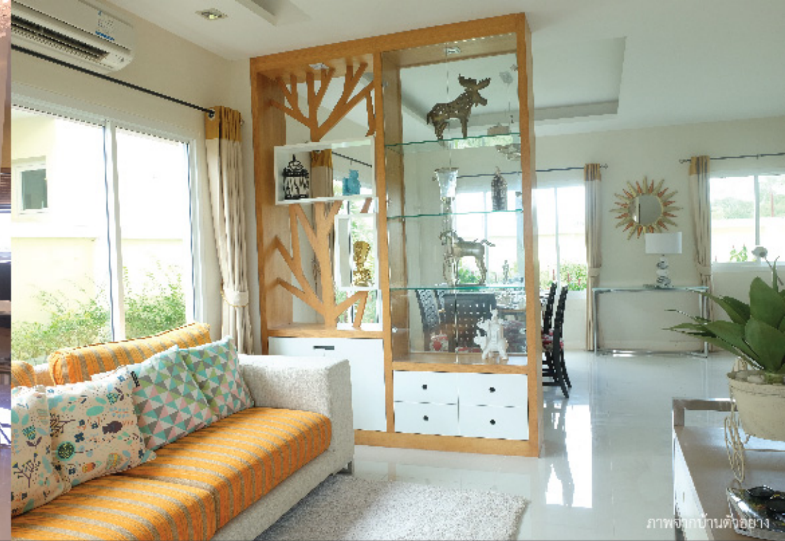
ภาพจากบ้านตัวอย่าง