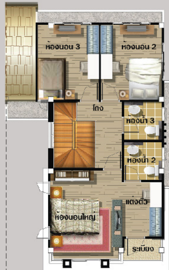
แปลนพื้นชั้น 2

บ้านแฟตสไตล์บ้านเดี่ยว 2 ชั้น 3 ห้องนอน 3 ห้องน้ำ จอดรถได้ 2 คัน พื้นที่ใช้สอยกว่า 144 ตร.ม. มีพื้นที่สวนกว้างขวาง