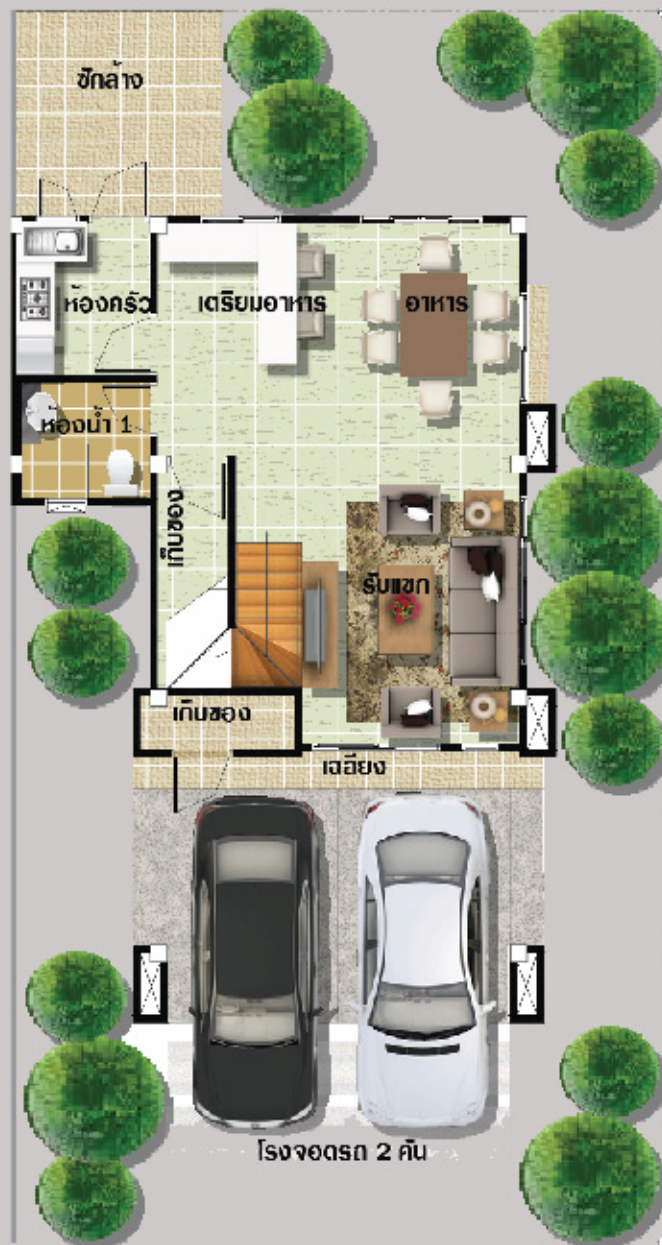
แปลนพื้นชั้นล่าง