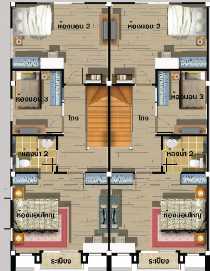
แปลนพื้นชั้น 2

ทาวน์เฮาส์ 2 ชั้น 3 ห้องนอน 2 ห้องน้ำจอดรถได้ 2 คัน พื้นที่ใช้สอยกว่า 147 ตร.ม.