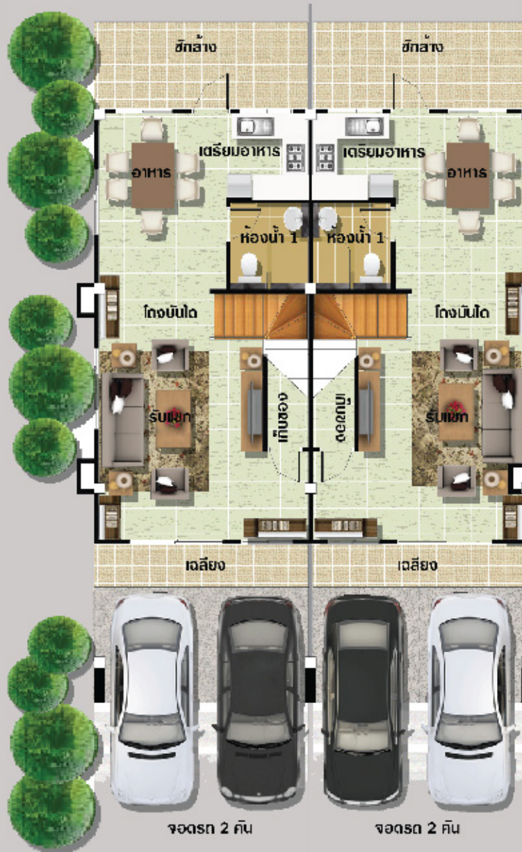
แปลนพื้นชั้นล่าง