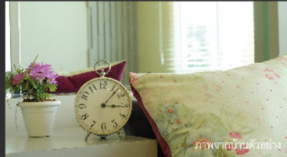
ภาพจากบ้านตัวอย่าง