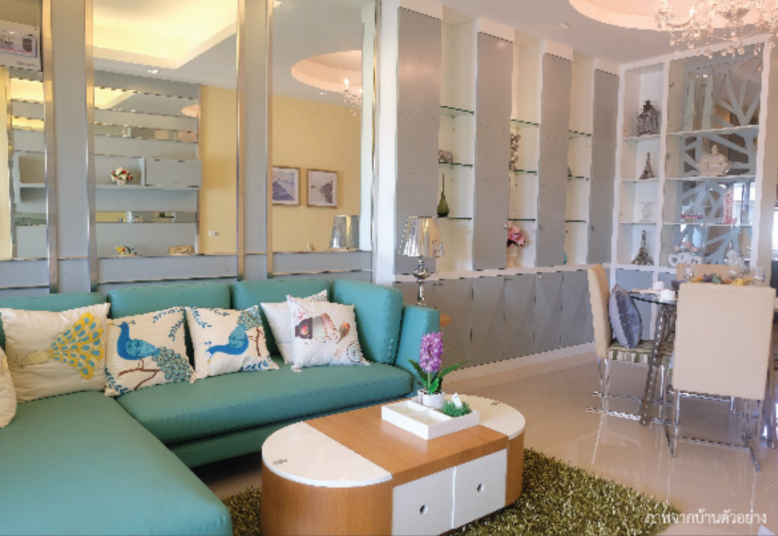
ภาพจากบ้านตัวอย่าง