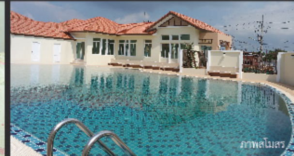
ภาพสโมสร